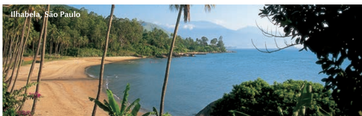
Ilhabela, São Paulo