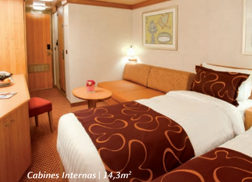
Cabines Internas | 14,3m 2