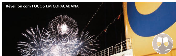
Réveillon com FOGOS EM COPACABANA