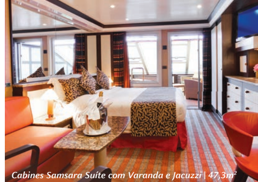
Cabines Samsara Suíte com Varanda e Jacuzzi | 47,3m 2

Imagens ilustrativas e apenas referencial de cabines.