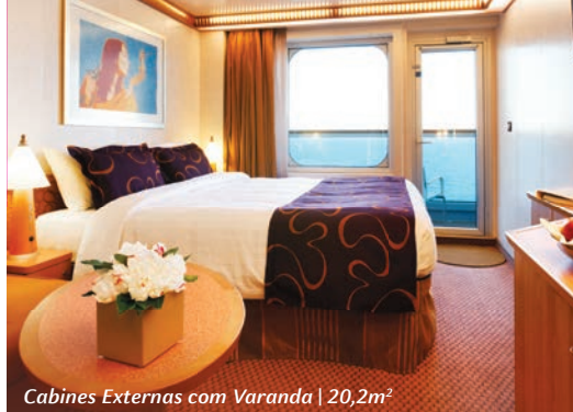
Cabines Externas com Varanda | 20,2m 2