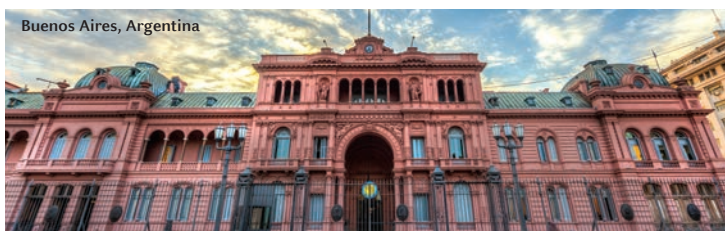
Buenos Aires, Argentina